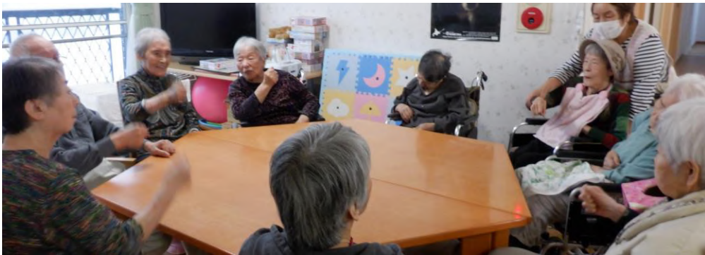
美味しいお菓子のクジ引きをしました。