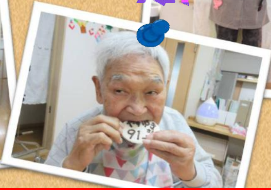
🎉 今月は、2名の入居者様の誕生日会を行いました！ 🎉