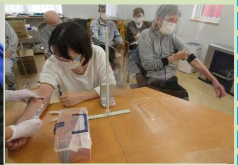
📝 往診でのインフルエンザワクチン接種の様子 📝