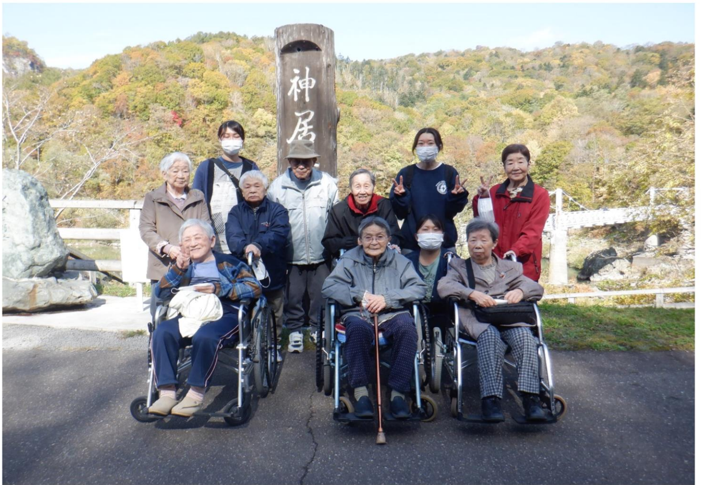
今年も紅葉を見に神居古潭に行ってきました～！！