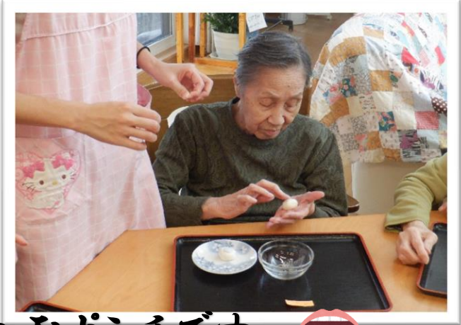
メニューは目玉白玉ポンチです