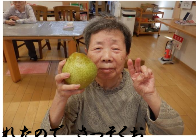
社長が梨を買ってくれたので、さっそくおやつに食べました🍏