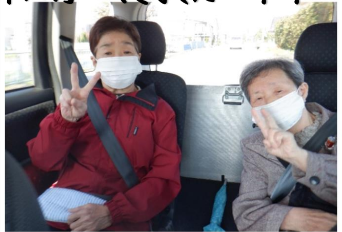
皆さんどこへ行くのかとソワソワされていました！笑