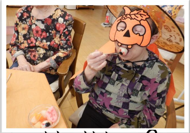
あまりにリアルに出来上がってしまいました...🍁