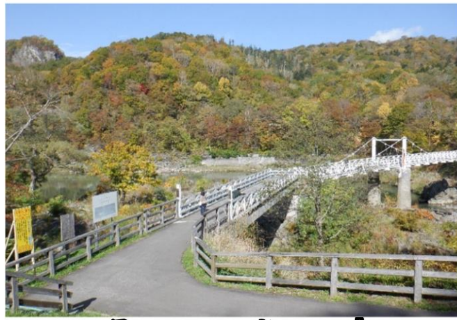
天気も気温も丁度よく最高の紅葉日和でした🍁