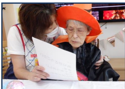
挨拶・・・とても嬉しいです♡