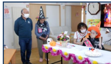
社長からKさんへお祝いの言葉♡