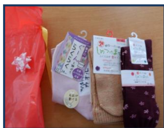
暖かい靴下は娘さんからです♡