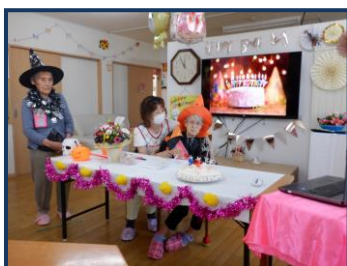
オンラインで娘さんと対談中♡