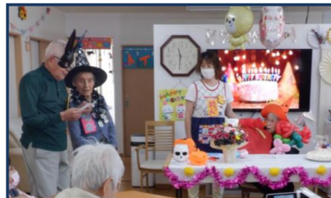
万歳三唱・・・Aさん♡