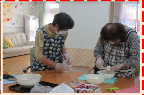
私たち稲荷ずし詰めましょう～