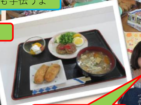
次は豚汁のジャガイモ切ろうか？