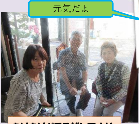
まだまだガラス越しですが、皆さん笑顔です😊