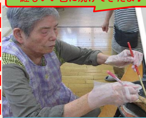
鮭もいい色に焼けてきたよ♪