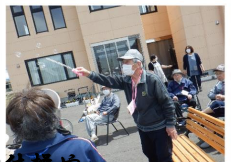
天気の良い日は、毎日外でラジオ体操やパークゴルフなど楽しんでいます