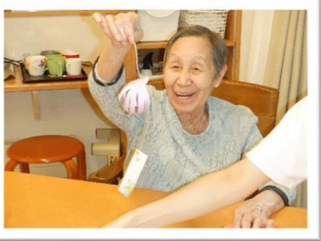
手作り風鈴大成功！！