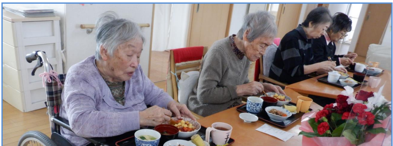
食欲モリモリです。