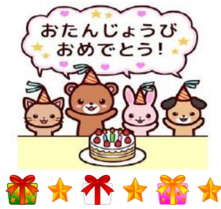
お誕生会役割担当です♡