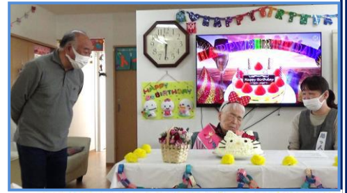
松原社長よりお祝いの言葉