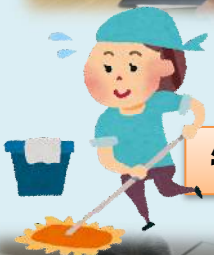
毎日みんなで協力して掃除など手伝って頂いてます♪