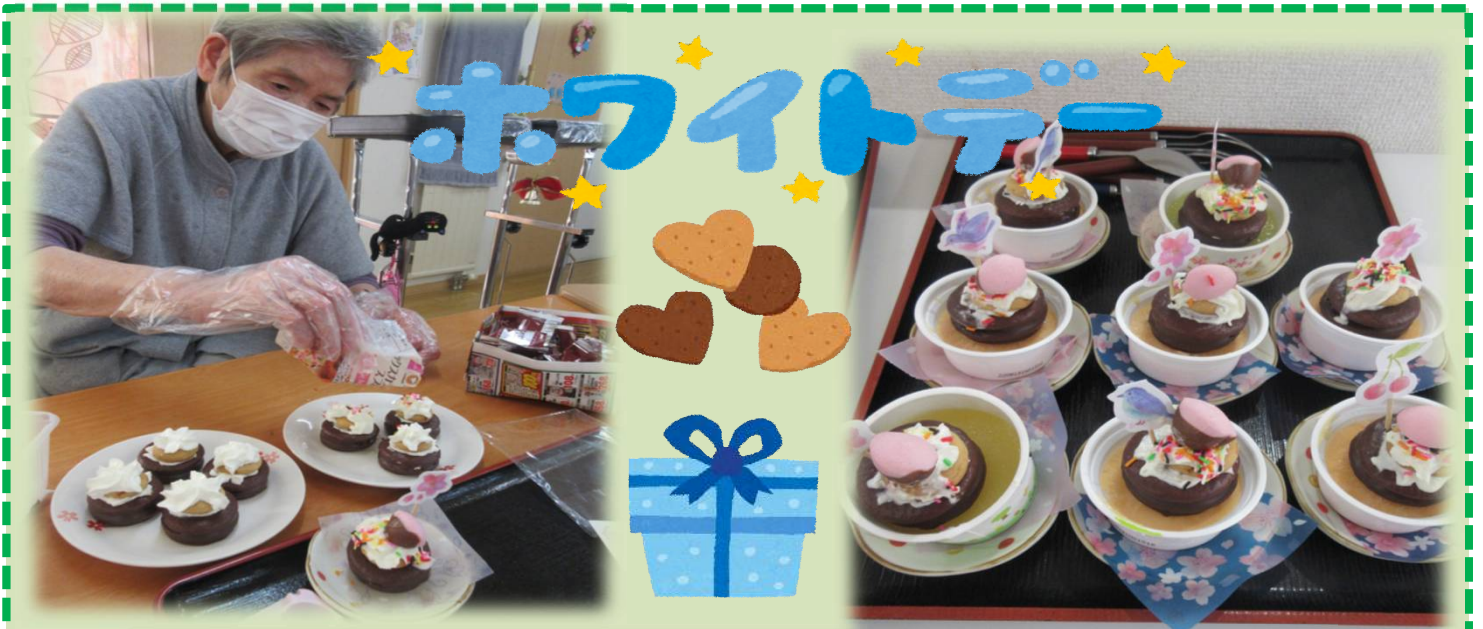
いつものおやつをアレンジしてホワイトデー風にしました！