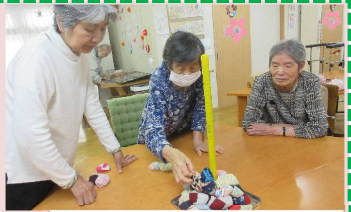
日常の様子。毎日いろいろなゲームをしています♪