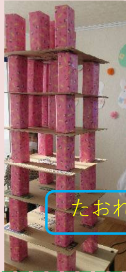
たおれそう・・・