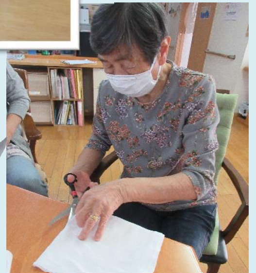
おやつのお菓子を分けたい、ふきんを縫ってきたい♪