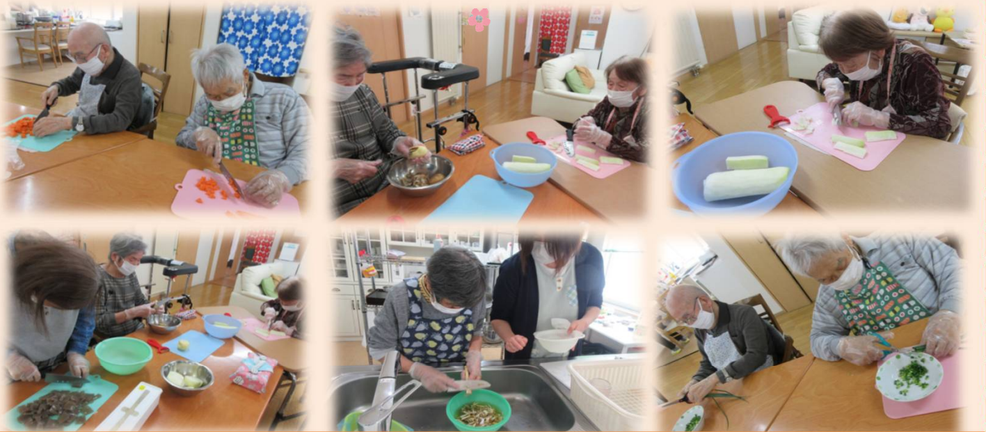
今月の調理メニューは豚汁・ウインナー・韓国海苔のおにぎり・キウイです。夕食も作っています！