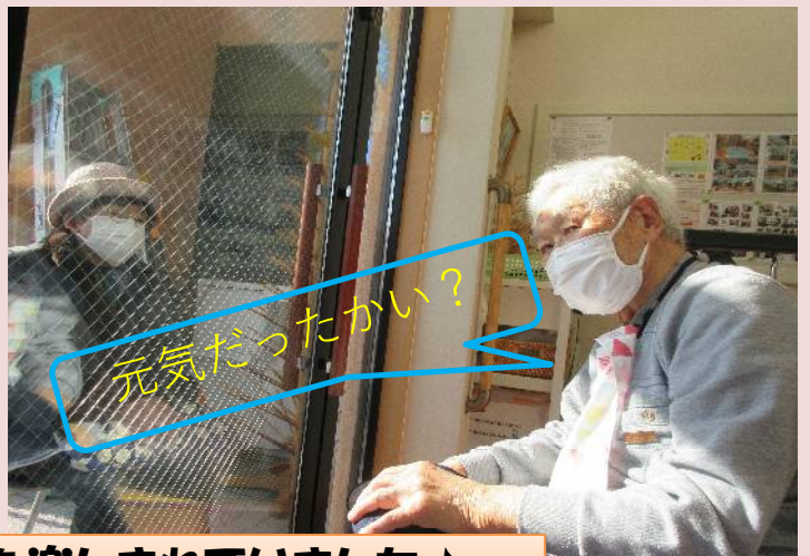
ご対面を楽しまれていました♪