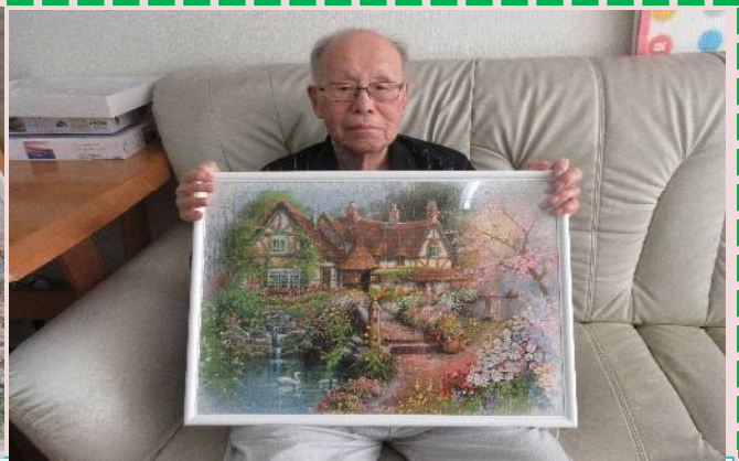
日常の様子。毎日パズルやいろんなゲームをしています♪