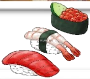
マグロ・エビ・サーモン・玉子 納豆・とびっこ軍艦