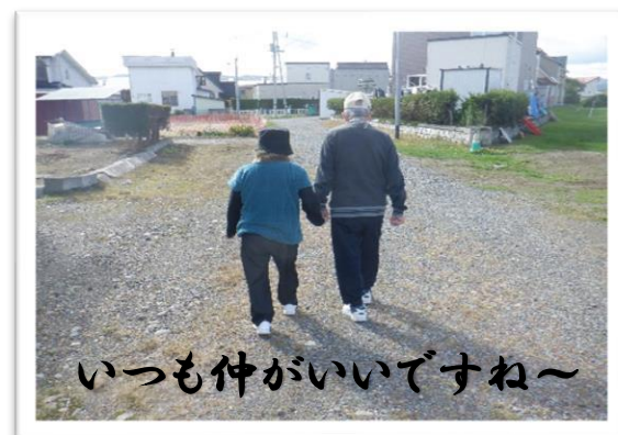
いつも仲がいいですね～