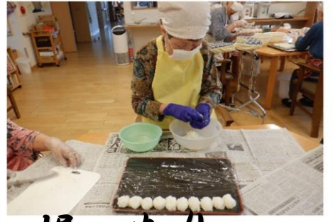
具材を切ったり、焼いたり、握ったり