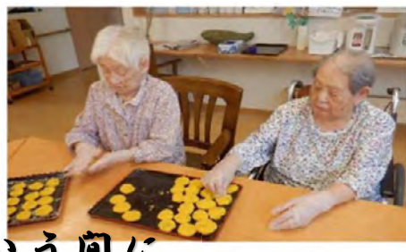
沢山作りましたが、あっという間に なくなりました！笑