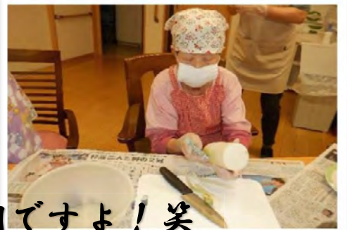
人参の皮むきだって真剣ですよ！笑