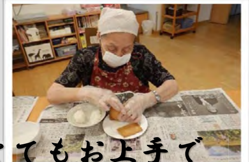
お二人ともとてもお上手でビックリ！