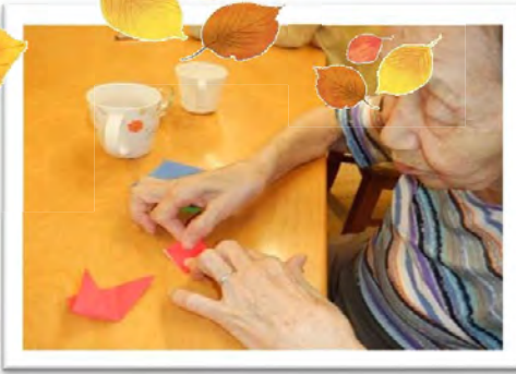
秋の飾り作り 柿の木：落ち葉：トンボ