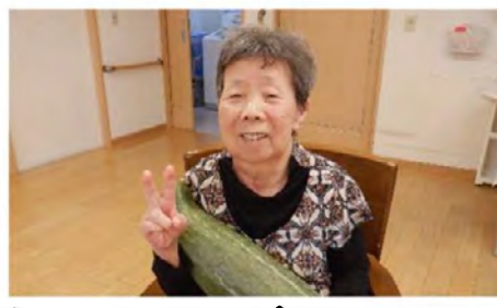
大きなカボチャに皆さんビックリ！