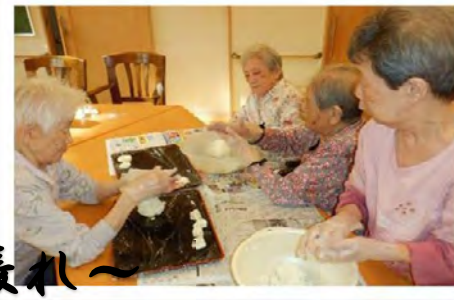
3人力を合わせて頑張れ～