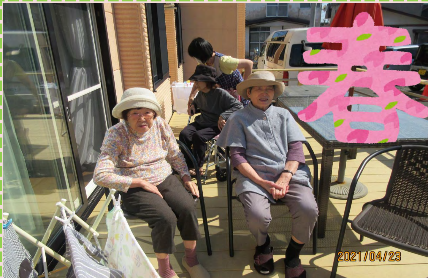
雪も解けて暖かくないテラスにも行けるようになりました☆彡