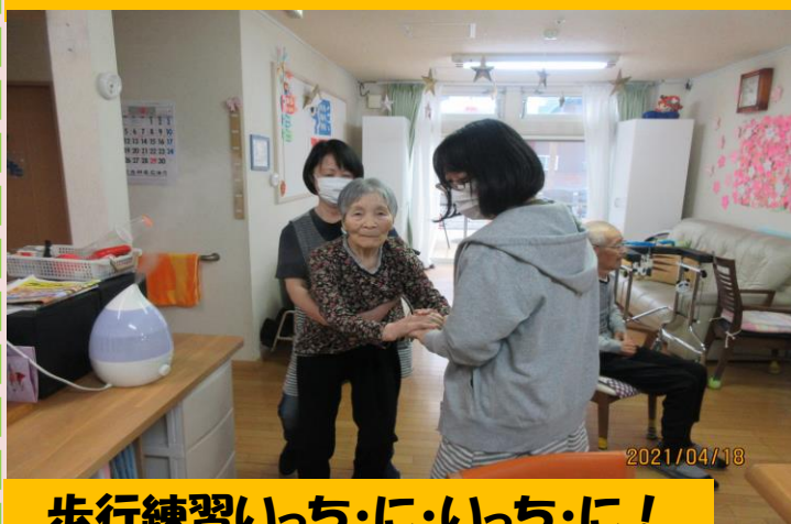
歩行練習いっち・に・いっち・に！