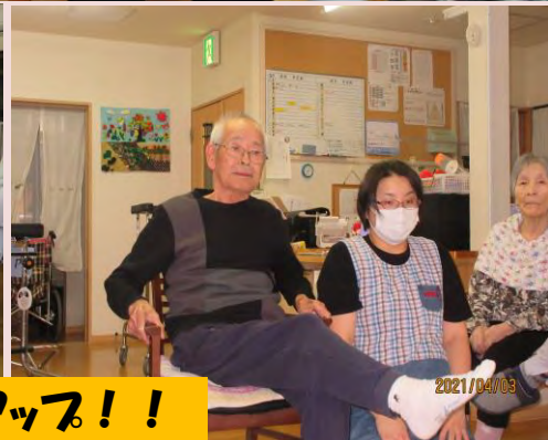
スリッパ飛ばして足の筋力アップ！！