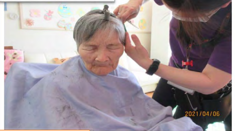
床屋さんの様子です ♪