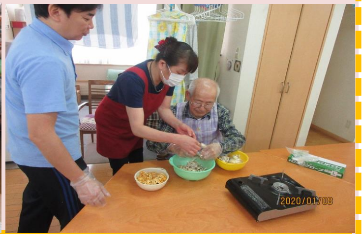
今月の調理はシチューに夕食の生姜焼きと、きいたんぽ鍋も作りました♪