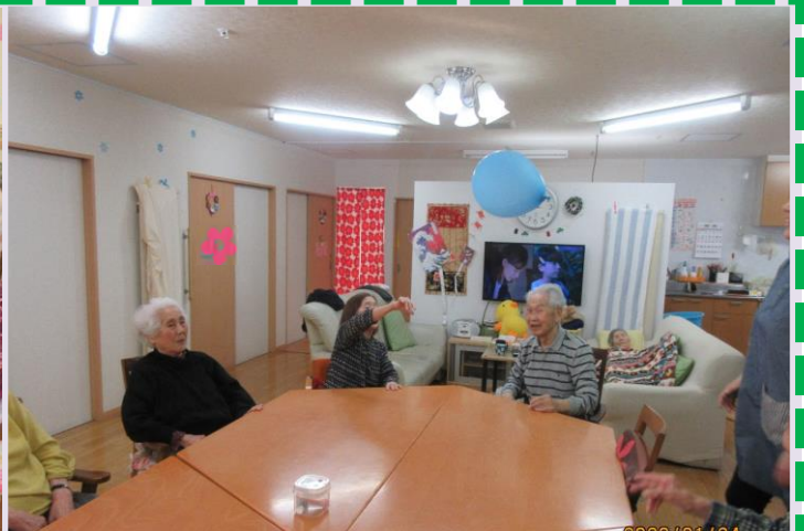
午前・午後とラジオ体操やストレッチ体操・ゲームや脳トレ毎日行っています(◇)♪